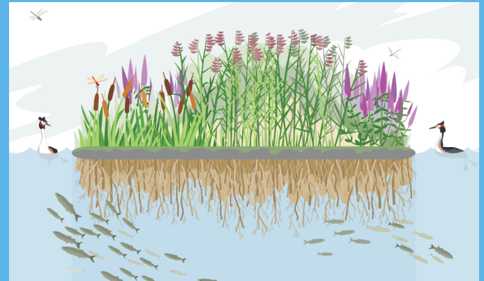
Schema einer schwimmenden Pflanzeninsel

Zusätzlich verstärken Edelstahlbojen den Auftrieb. Blühender Blutweiderich, Sumpf-Schwertlilie, aber auch Sumpf-Segge und gewöhnliche Teichbinse wurden auf Kokosnusssfasermatten angepflanzt und auf die schwimmenden Unterbauten gelegt.